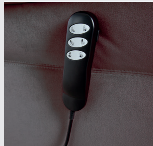
Leicht bedienbare Handschalter

- geölt: Erle Öl, Rotkernbuche Öl, Wildeiche Öl