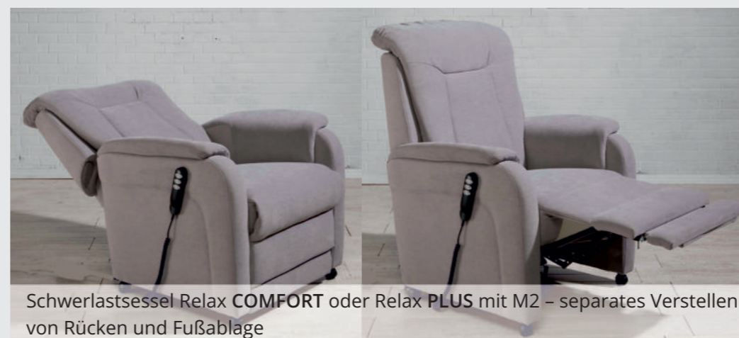
Schwerlastsessel Relax COMFORT oder Relax PLUS mit M2 – separates Verstellen von Rücken und Fußablage