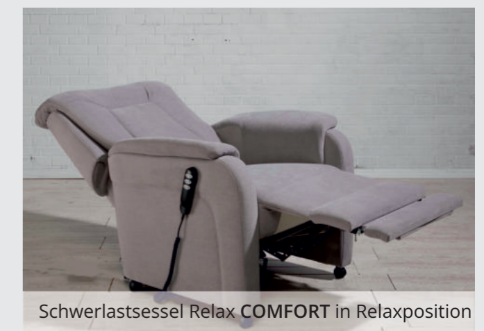
Schwerlastsessel Relax COMFORT in Relaxposition