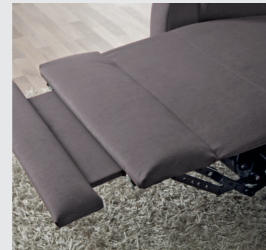
Komfortable Verlängerung der Fußablage bei den Schwerlastsesseln Relax COMFORT und Relax PLUS